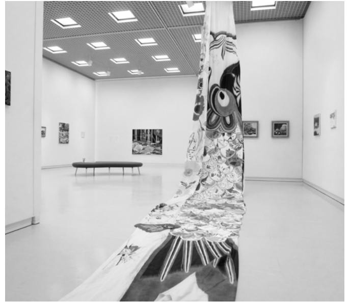
「こののぼり」展示風景 2012 島根県立美術館ギャラリー